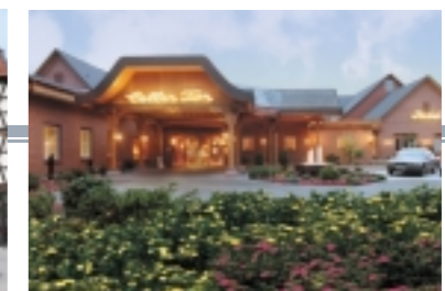
Ringhotel Zeller Tor, Zelle