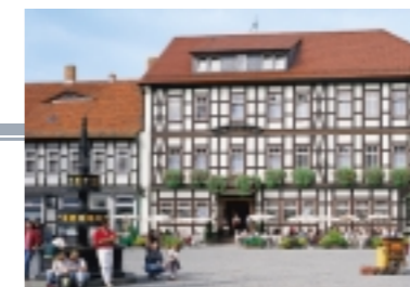
Ringhotel Weißer Hirsch, Wernigerode